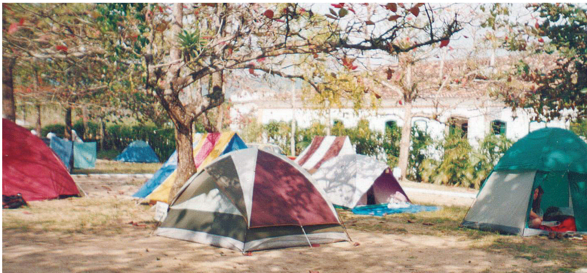
► O camping de Paraty se prepara para a Festa do Divino no fim deste mês e para a nova edição da Feira Literária, em julho (Página 4)