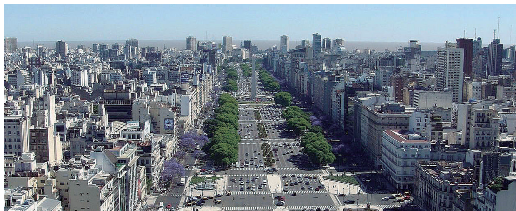
► Aproveite as tarifas promocionais para apreciar um tango e tanto mais em Buenos Aires

Rua Senador Dantas, 75 – 27º andar – sala 2707 Rio de Janeiro (RJ) - Tel/Fax: (21) 2240-5390