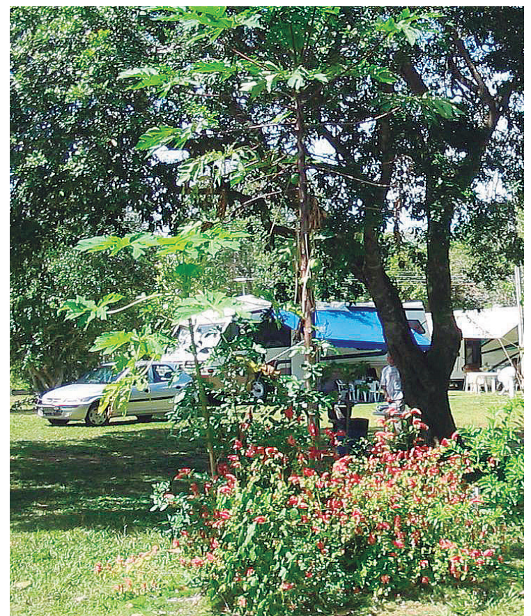
► Um pouco mais distante, o camping de Aracruz também oferece apoio aos Passos de Anchieta

O agroturismo possui os Circuitos Guaraná e Jacupemba, que propiciam passeios nos quais os visitantes encontram restaurantes, lagoas para pescaria, córregos, fazendas, passeios de charrete, parquinhos e casas antigas.