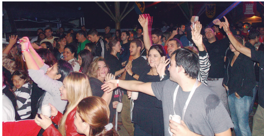
► O clima frio e o feriadão prometeu elevar o tom da confraternização no pavilhão

Cada convite dá direito a uma embalagem com cinco qualidades de queijos, uma porção de patê, manteiga e pão, mais um caneco personalizado para serviço de vinho tinto ou