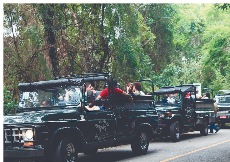
► Com tempero de aventura, a Jeep Tour leva os turistas a um Rio de Janeiro diferente

“A Jeep Tour não possui novas rotas até o presente momento, mas existe a possibilidade de lançarmos o turismo eco rural em Itaipava, que vai se chamar Cir-