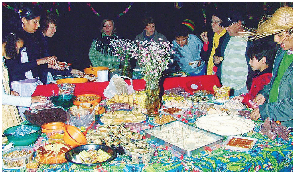
► Depois da Paella Dançante, vem aí o arraiaí de Mury

CABO FRIO - O camping fica na Av. Wilson Men-