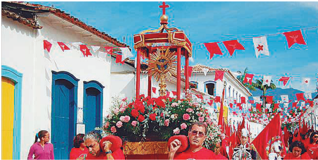
► Na sequência de festas o ano todo, chegou a hora da Festa do Divino

D o dia 30 deste mês a 8 de junho a cidade de Paraty, na região da Costa Verde promove uma de suas mais badaladas festas onde o folclore e o turismo atraem visitantes à Cidade. Os campistas associados e convidados do CCB podem usar o apoio do camping de Paraty, junto ao centro histórico e fronteiro à praia do Pontal. A festa em si é centenária. Atribuída à Rainha Isabel (1271 - 1336), a Festa do Divino chegou ao Brasil trazida pelos colonizadores e vem acontecendo em Paraty desde o século XVIII. Pelas suas enormes proporções, envolvendo praticamente toda a comunidade, a festa começa a ser organizada um ano antes de sua realização: escolhido pela Paróquia, um “festeiro” administra dezenas de voluntários - às vezes mais de um para cada atividade, seja religiosa ou profana.