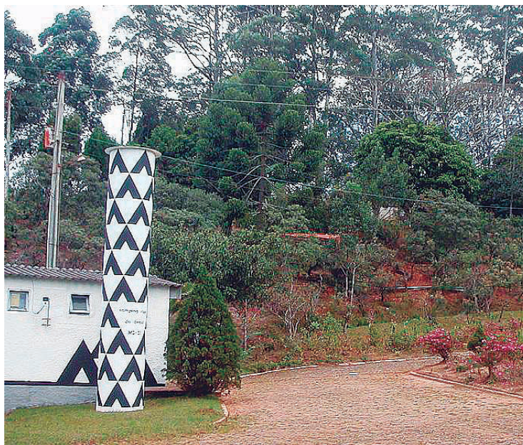
► As celebrações de Corpus Christi e o Festival de Inverno se aproximam em Ouro Preto