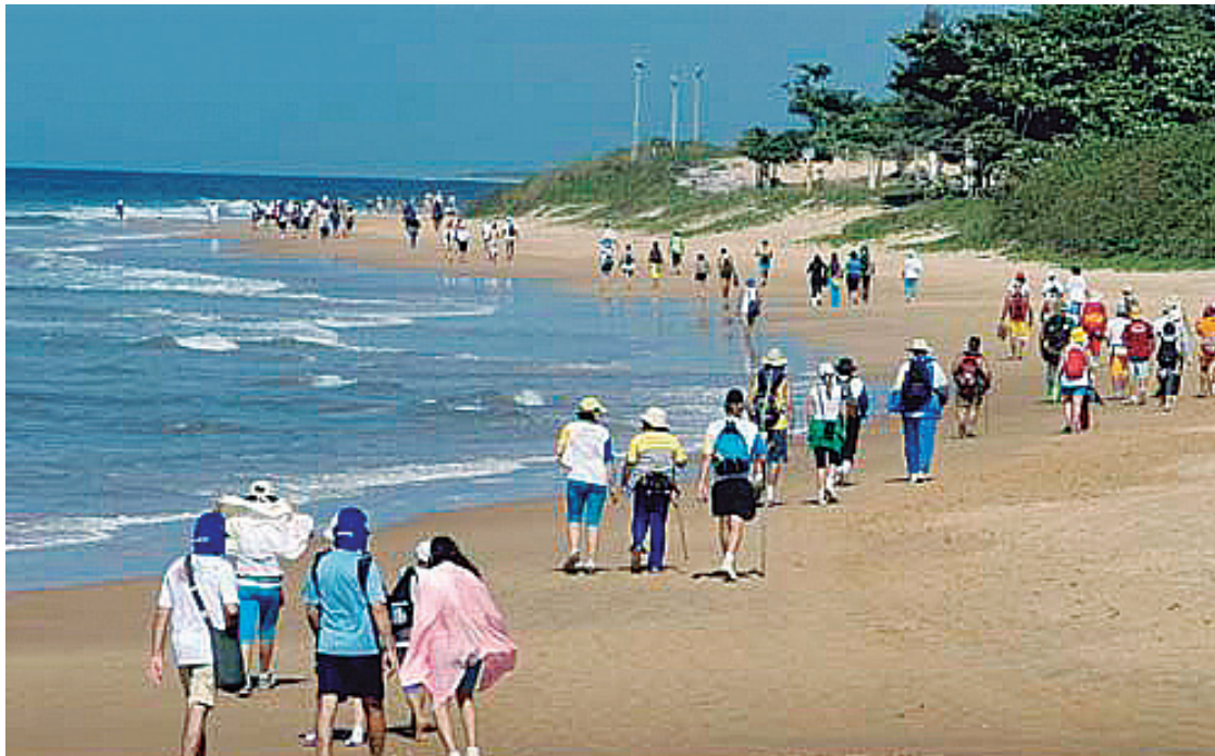
► É melhor acampar em Guarapari para viver as reflexões da caminhada até Anchieta

Para o campista que esteja de passagem pela região e deseje uma hospedagem com segurança, o CCB disponibiliza