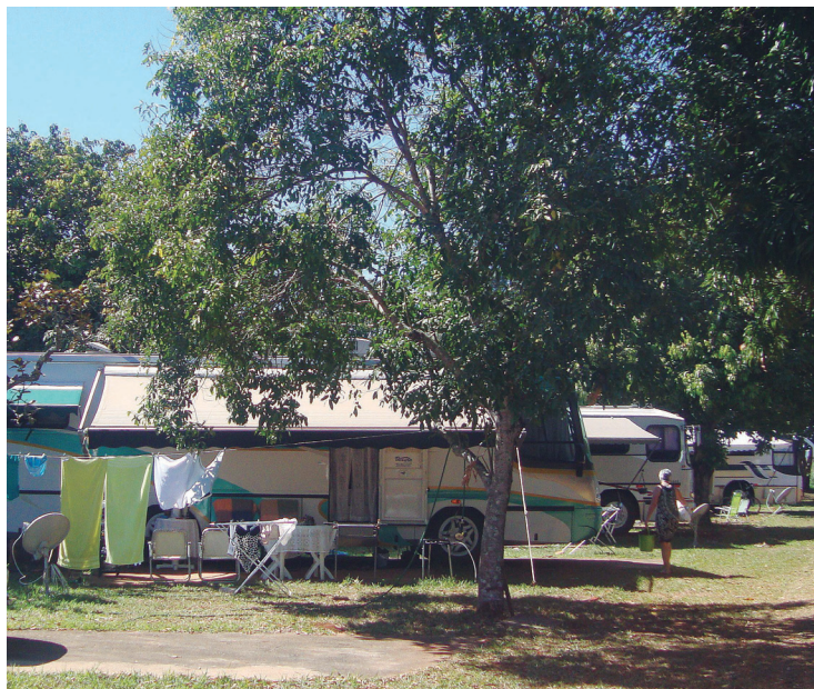
► E os sulistas começam a chegar para o calor de Caldas Novas

pratos típicos, como o frango ao molho pardo acompanhado de arroz, angu e couve, ou o feijão-tropeiro e o frango com quiabo.