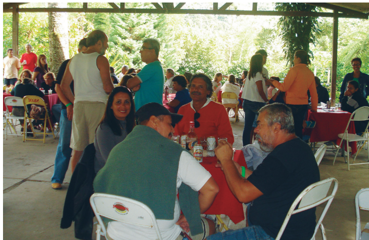
► A confraternização foi um dos pontos altos da passagem gastronômica

A comida foi servida à vontade e a bebida comercializada na cantina. A Paella é um dos pratos típicos da culinária espanhola, preparada com o arroz cozido com carnes, frutos do mar, hortaliças e açafrão. Além do prato saboroso, o campista teve também a oportunidade de desfrutar de um ambiente de pura natureza, florido e sombreado. Mury é um dos lugares mais lindos da cidade e ideal para você desfrutar dos encantos naturais com a família e amigos.