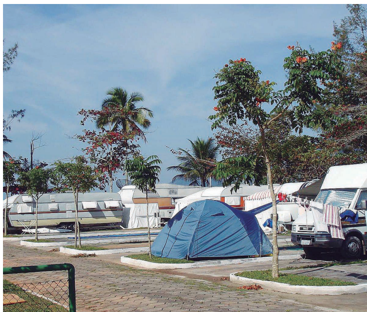
► O sol da praia fronteira em Ubatuba ainda lembra o calor do verão que passou

Depois de todo esse trajeto, nada melhor que saborear